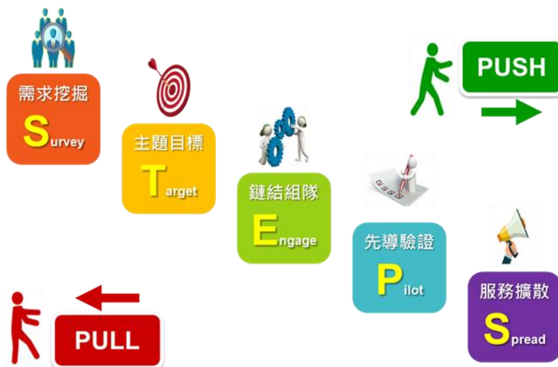
▲ 圖 2 資策會 ACE 培訓 STEPS 方法