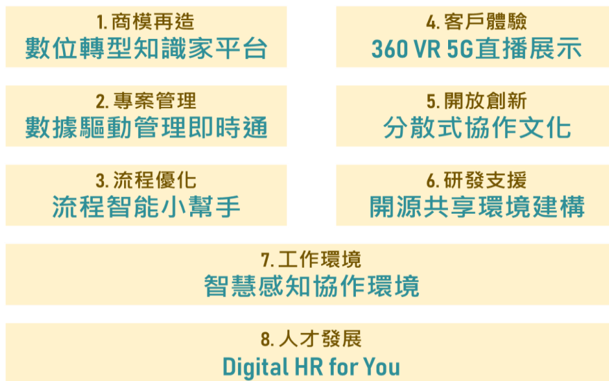
▲ 圖3 資策會 ACE 培訓-轉型實戰主題

8.主題八：人才發展—Digital HR for You。針對資策會所需的數位科技人才建立資料庫，並搭建引導產業人才供需雙方加入的平台，逐步建構數位轉型人才發展生態系。